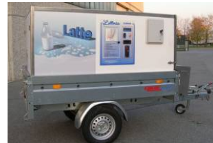
Ambulantna prodaja (škrinja, aparati za sladoled i sl.)