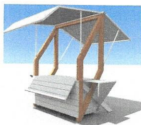
Štand (rukotvorine, igračke, suveniri i sl.)