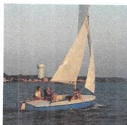
Jedrilica, brodica na vesla