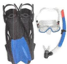
Pribor i oprema za ronjenje, kupanje i sl.