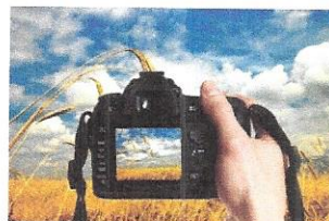
Slikanje i fotografiranje