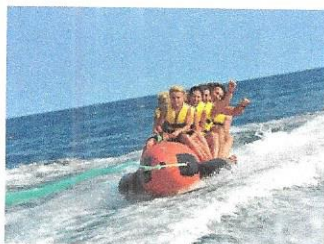
Sredstvo za vuču s opremom