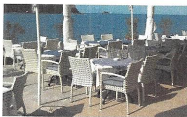
Pripadajuća terasa objekta - m 2