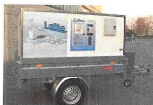
Ambulantna prodaja (škrinja, aparati za sladoled i sl.)