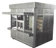
Kiosk, prikolice montažni objekti do 12 m 2