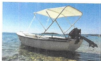
Brodica na motorni pogon