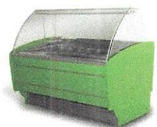
Ambulantna prodaja: škrinja za sladolede