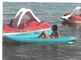
Daska za jedrenje, sandolina, pedalina i sl.