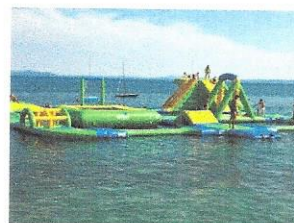
Agua park i drugi morski sadržaji