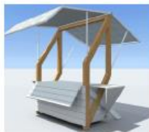
Štand (rukotvorine, igračke, suveniri i sl.)