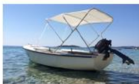
Brodica na motorni pogon