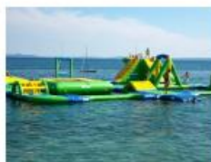
Agua park i drugi morski sadržaji