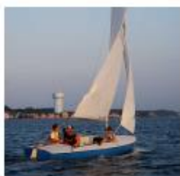
Jedrilica, brodica na vesla