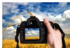
Slikanje i fotografiranje