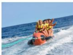
Sredstvo za vuču s opremom