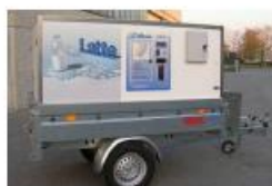
Ambulantna prodaja (škrinja, aparati za sladoled i sl.)