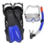
Pribor i oprema za ronjenje, kupanje i sl.