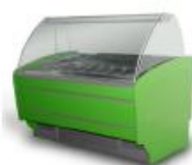
Ambulantna prodaja: škrinja za sladolede