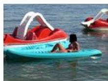
Daska za jedrenje, sandolina, pedalina i sl.