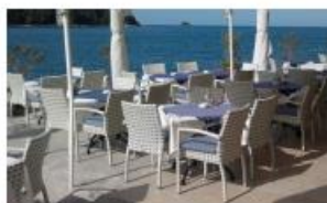
Pripadajuća terasa objekta - m 2