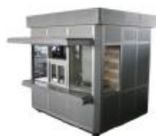
Kiosk, prikolice montažni objekti do 12 m 2