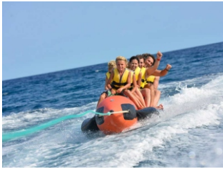
Sredstvo za vuču s opremom