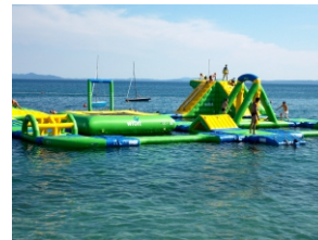
Agua park i drugi morski sadržaji