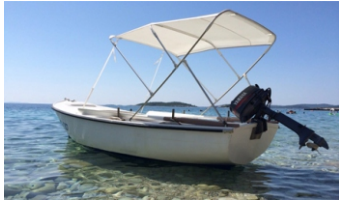
Brodica na motorni pogon