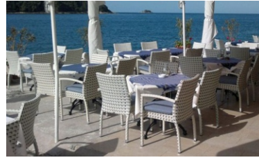
Pripadajuća terasa objekta - m 2