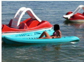
Daska za jedrenje, sandolina, pedalina i sl.