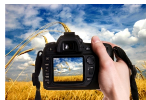
Slikanje i fotografiranje