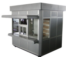
Kiosk, prikolice montažni objekti do 12 m 2