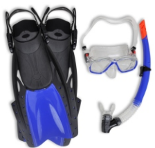
Pribor i oprema za ronjenje, kupanje i sl.