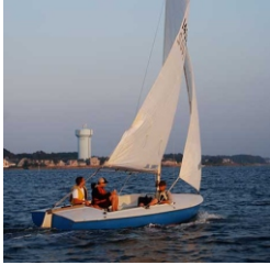
Jedrilica, brodica na vesla