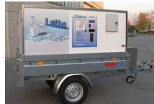
Ambulantna prodaja (škrinja, aparati za sladoled i sl.)