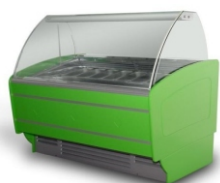
Ambulantna prodaja: škrinja za sladolede