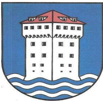
Slika Grb i zastava Općine Marina

Prema statutu Općine Marina kojim se uređuje samoupravni djelokrug, njegova obilježja, javna priznanja, ustrojstvo, ovlasti i način rada tijela, Općina Marina je osnovana po Zakonu o područjima županija, gradova i općina u Republici Hrvatskoj („Narodne novine „ br. 90/92).